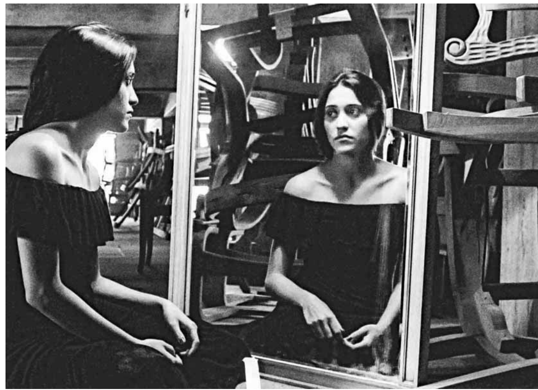
Spleen, una obra teatral con vision cinematográfica

Los premios WGA, celebrados con galas simultáneas en Los Ángeles y Nueva York, también reconocieron a The Handmaid's Tale en el apartado de serie dramática y a Veep en la categoría de mejor comedia televisiva. Asimismo, el guion de Jane fue el ganador del premio a mejor documental.