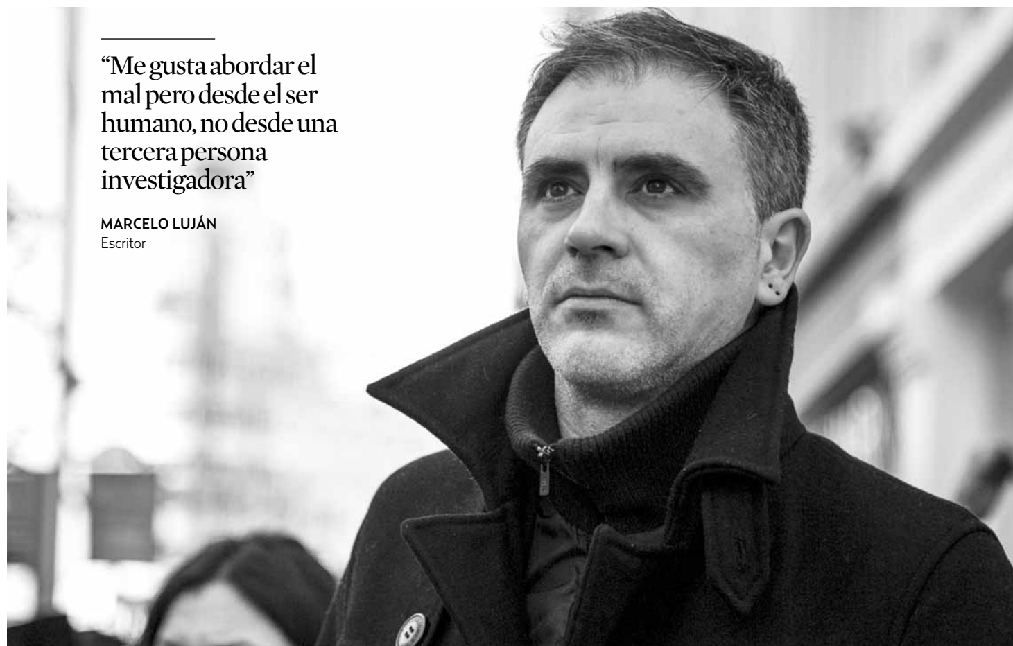
En 2016 el autor recibió por “Subsuelo” el Premio Santa Cruz de Tenerife, el Premio Novelpol y el Premio Dashiell Hammett

nero está abarcando muchos más, como la novela social o la novela crítica política.